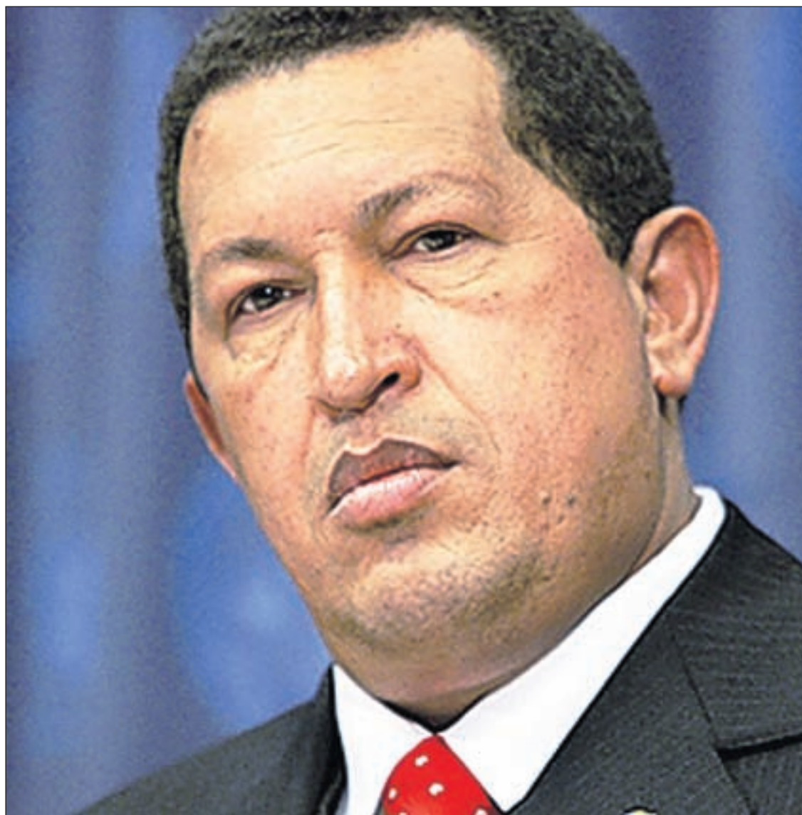
Presidente Chavez saca durante un evento un aña pasa.

CARACAS (AP) – E dudanan riba capacidad di presidente Hugo Chavez di sigui den su funcionnan, particularmente riba su berdadero estado di salud, ta sigui crece entre e Venezolanonan, sorprendi repetidamente pa anuncianan cu ta pone den duda su supuesto recuperacion, segun ta wordo bisa.